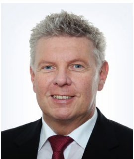
Dieter Reiter Oberbürgermeister der Landeshauptstadt München

„Für die Leistungsfähigkeit der Stadtverwaltung in München benötigen wir qualifizierten Nachwuchs. Mit dem gemeinsam mit der FOM Hochschule entwickelten Bachelor of Laws – Öffentliches Recht können wir als Landeshauptstadt München die Studierenden gezielt auf die vielfältigen Verwaltungsaufgaben mit rechtlichem Bezug vorbereiten. Das duale Studium ist zudem ein wichtiges Signal nach außen. Es lohnt sich, seine Berufslaufbahn bei der Stadt zu starten.“