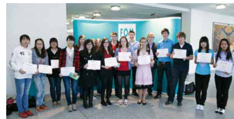
Die deutsch-chinesischen Siegerteams des Schülerprogramms 2012

ab 16:15 Uhr Ehrung der Gewinner und feierliche Preisvergabe