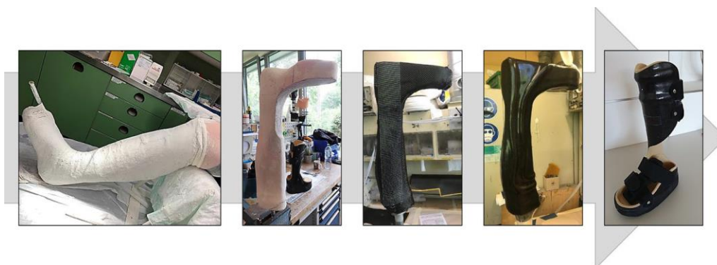
Abbildung 1: Konventionelle Herstellung einer Unterschenkelorthese aus CFK (Schafran & Kullmer 2019)

Um die Kompromisse der handwerklichen Fertigung zu minimieren und dem zu erwartenden Bedarfsanstieg an Hilfsmitteln gerecht zu werden, kann eine standardisierte digitale Prozesskette (siehe Abbildung 2) in Kombination mit einem 3D-Druckverfahren herangezogen werden. Bei der Umsetzung steht das handwerklich geprägte Gesundheitshandwerk derzeit jedoch noch vor Herausforderungen, da zum Beispiel notwendige Methoden wenig bekannt beziehungsweise nicht in der Branche verbreitet sind.