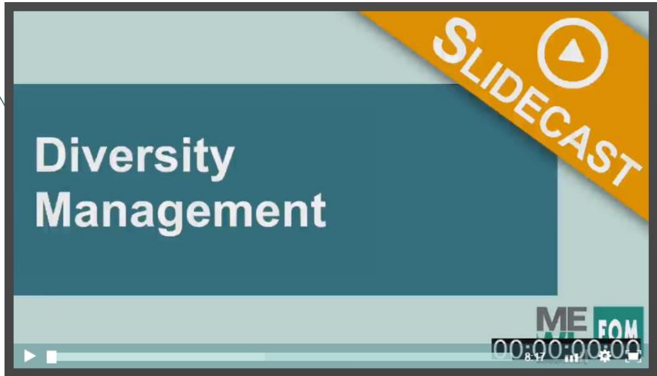
Checkliste für Diversity-Kompetenz in der Hochschullehre