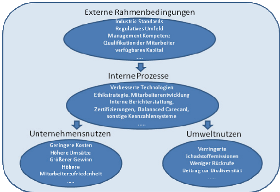
Abb. 2: Leistungstreiber für ethisches Verhalten

Als Leistungstreiber für ethisches Verhalten können zum einen unterstützende externe Rahmenbedingungen, wie das regulative Umfeld und der Input an Mitarbeiter- und Managementqualifikation betrachtet werden. Zum anderen dienen als Leistungstreiber interne Prozesse, zu denen die Ethikstrategieentwicklung und Controllingprozesse über Zertifizierungen, BSC's und sonstige Kennzahlensysteme gehören.