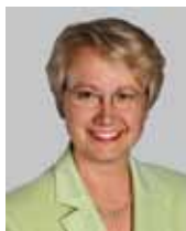
Unter der Schirmherrschaft von Bundesministerin Dr. Annette Schavan

»Studien belegen, dass bis 2014 in Deutschland jedes Jahr bis zu 62.000 hochqualifizierte Akademiker fehlen. Das »Begabtenförderprogramm Wirtschaft« der Claussen-Simon-Stiftung in Kooperation mit der FOM Hochschule für Oekonomie & Management macht dabei einen zukunftsweisenden Schritt. Das Programm ermöglicht schon motivierten Oberstufenschülerinnen und -schülern den Einstieg in ein wirtschaftsorientiertes Studium und leistet damit einen wichtigen Beitrag zur Talentförderung. Zudem eröffnet diese Initiative jungen Frauen und Männern schon früh Kontakte zu Unternehmen.«